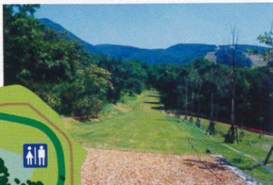
▲2kmショートカットコース付近(一部ウッドチップ)