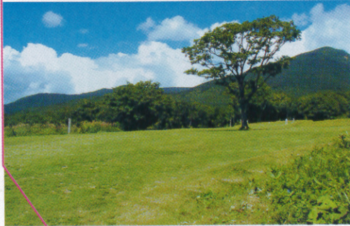
▲クロスカントリーコーススタート地点