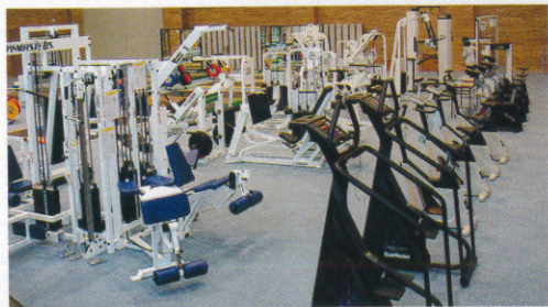
▲トレーニング室全景