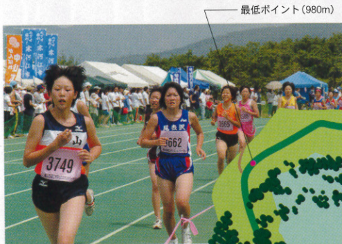
▲爽やかな季節の蔵王グリーングラウンド